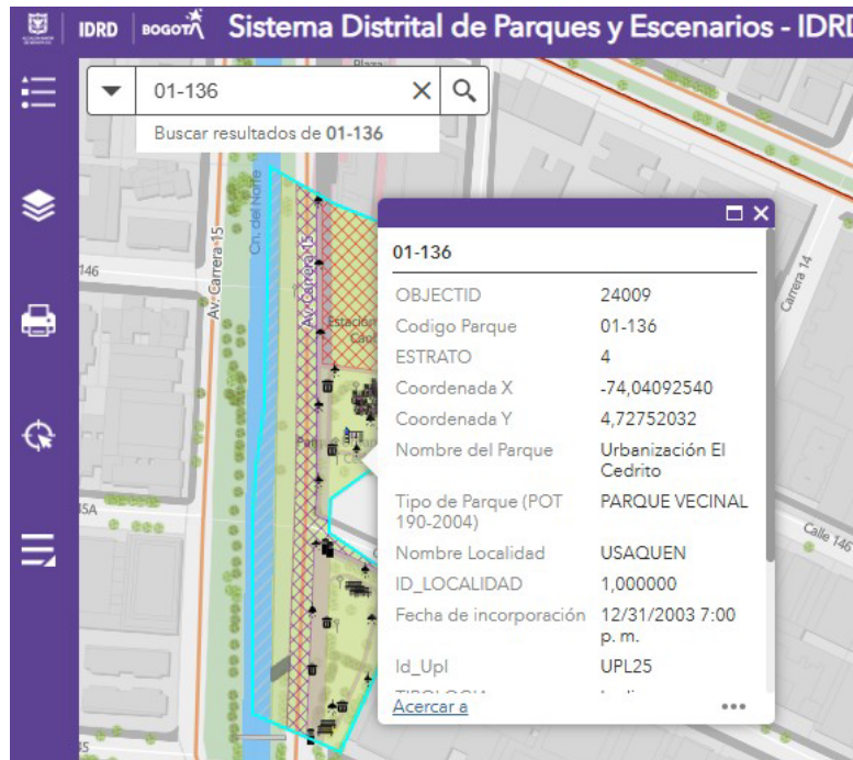
Imagen 1. Visor de Parques IDRD – Parque Urbanización el Cedrito

El equipo técnico de la Subdirección Técnica de Parques informa que el pasado 14 de junio del año 2026 realizó visita técnica al parque denominado Urbanización el Cedrito identificado con el código 01-136 ubicado en la localidad de Suba.