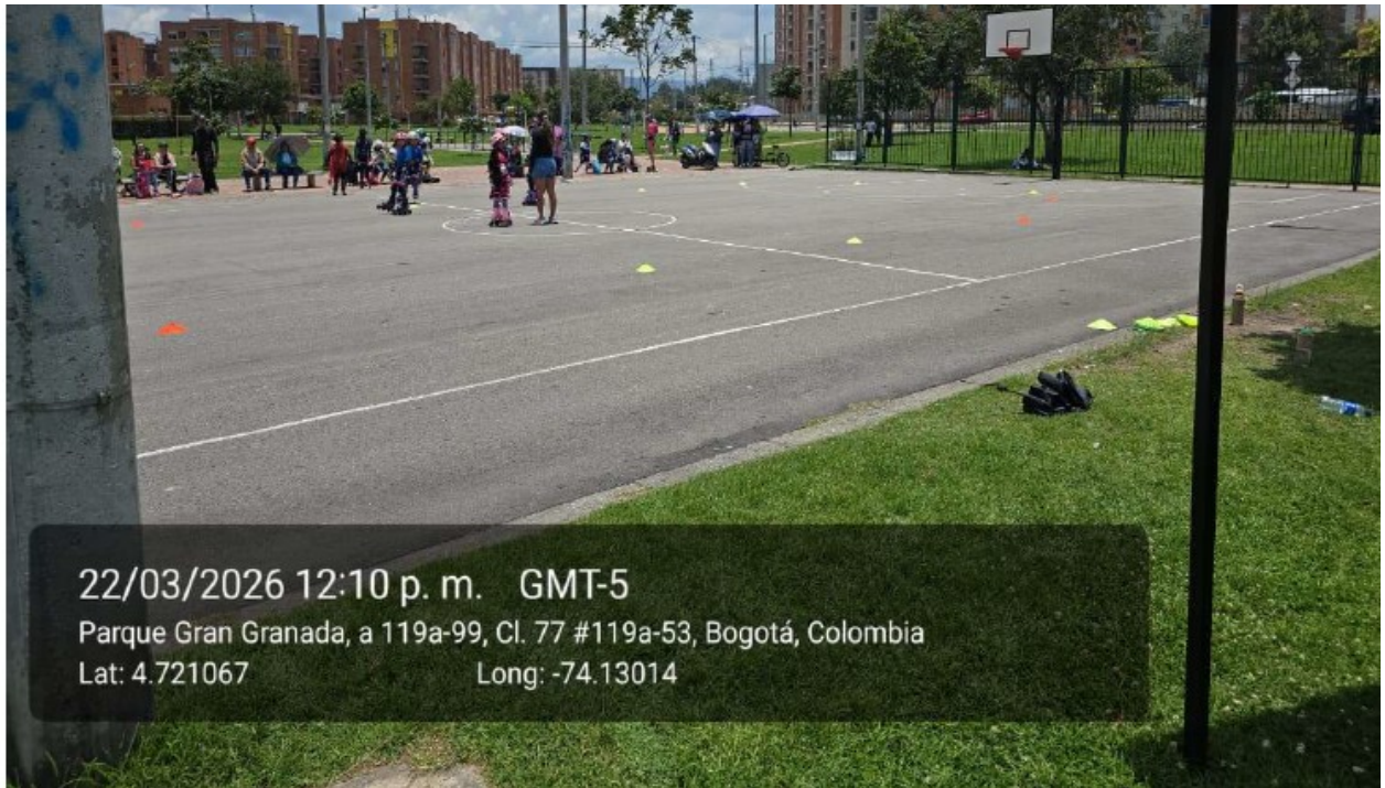
22/03/2026 12:10 p. m. GMT-5 Parque Gran Granada, a 119a-99, Cl. 77 #119a-53, Bogotá, Colombia Lat: 4.721067 Long: -74.13014