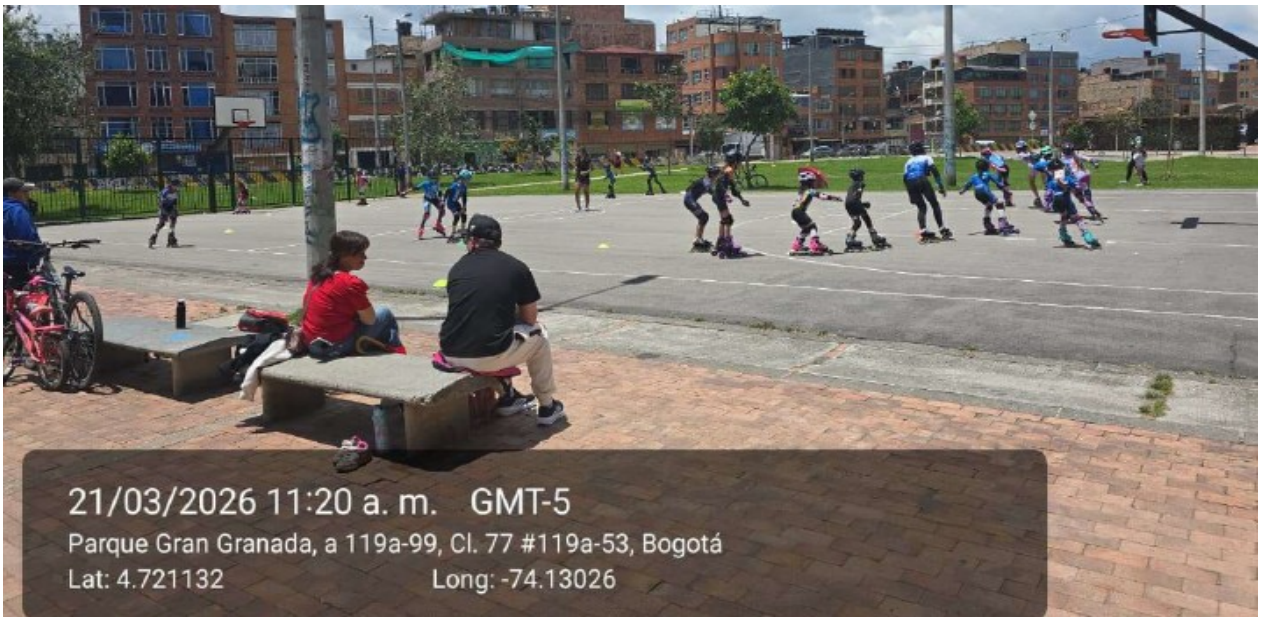
21/03/2026 11:20 a. m. GMT-5 Parque Gran Granada, a 119a-99, Cl. 77 #119a-53, Bogotá Lat: 4.721132 Long: -74.13026