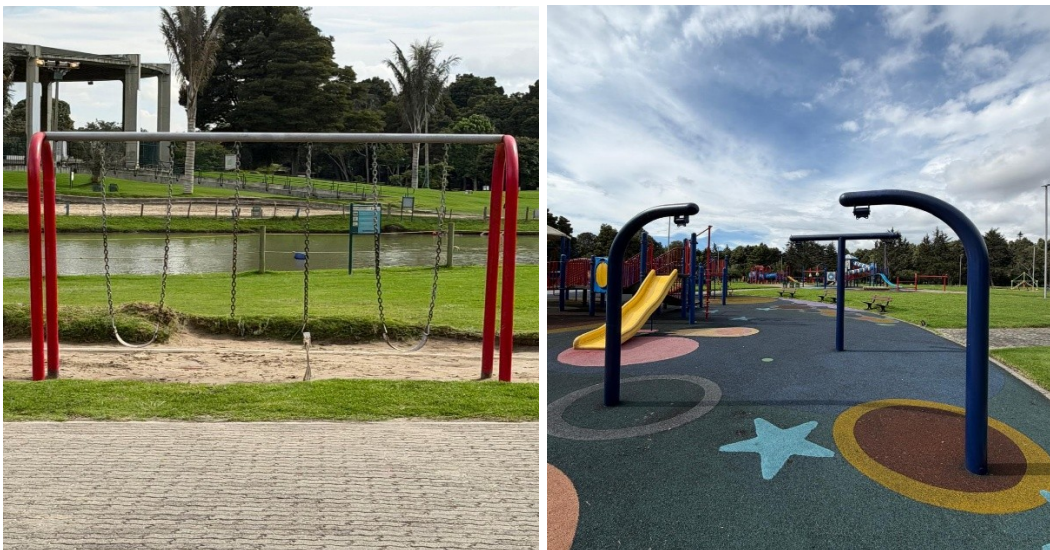
Imagen 1 y 2: Columpios y juego desarmado – abril 2026.

En virtud de la situación expuesta, se realizó visita de verificación en el parque Simón Bolívar sector Central, el día 20 de abril del 2026, cómo se observa en el registro fotográfico adjunto por parte del personal técnico de la Subdirección Técnica de parques.