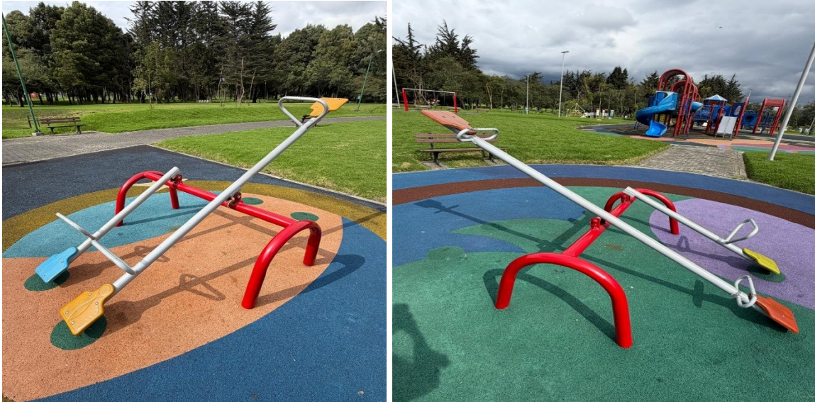
Imágenes 3 y 4: Juegos Sube y baja – abril del 2026.