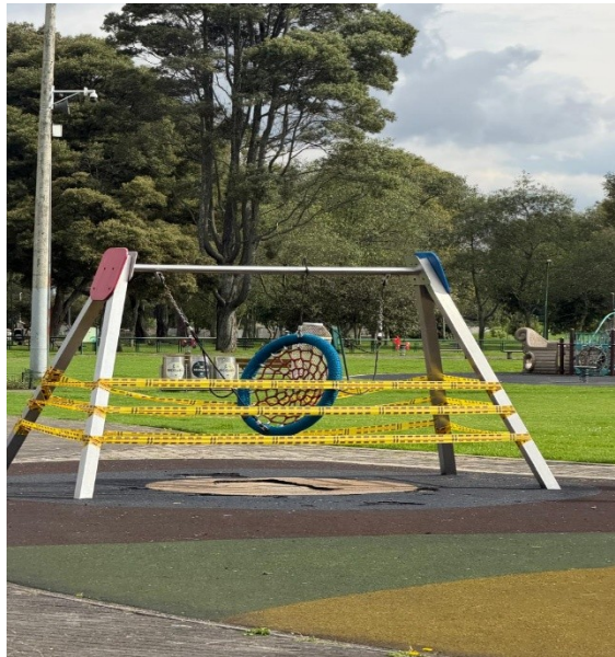
Imagen No.5 Columpio de inclusión

Como resultado de la visita de revisión realizada en la zona infantil del parque, se evidenció que uno de los módulos tipo columpio no cuenta actualmente con los elementos suspendidos de uso, retirados previamente por deterioro. De igual manera, se observó otra estructura recreativa con ausencia parcial de componentes funcionales (Ver Imágenes 1 y 2). Adicionalmente, se verificó que uno de los juegos tipo sube y baja presenta deterioro en algunos de sus componentes (Imágenes 3y 4).