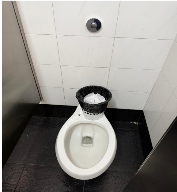
Imágenes 1 y 2: Baños parque UDS marzo 2026

Respecto a la novedad presentada durante los días señalados, se identificó que esta obedeció a intervenciones adelantadas en el sector de la avenida 68, por parte del Acueducto, las cuales generaron una afectación temporal en el suministro de agua al parque. En consecuencia, se precisa que la situación correspondió a un evento externo y de carácter transitorio, el cual ya fue superado, encontrándose actualmente restablecidas las condiciones de operación de los baños.