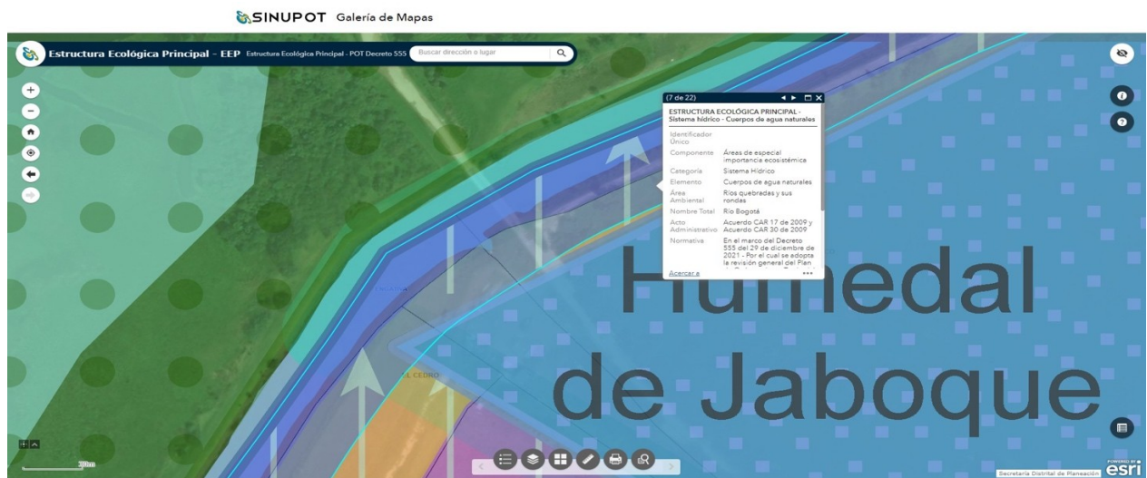
Imagen 1 - Mapa Estructura Ecológica Principal - POT Decreto 555 – SDP

En ese mismo sentido y según lo definido en la cartografía del Decreto 555 del 2021, se concluye que la zona donde se ubica el elemento corresponde a un Área de Especial Importancia Ecosistémica con categoría de Sistema Hídrico - Cuerpos de agua naturales - ríos quebradas y rondas nombrada como Río Bogotá ( imagen 1 ), delimitada bajo el Acuerdo CAR 17 de 2009 y Acuerdo CAR 30 de 2009.