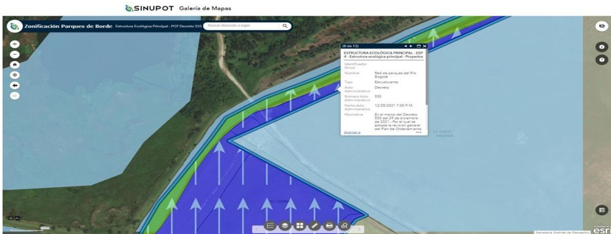
Imagen 3 - Mapa Zonificación Parques de Borde Estructura Ecológica Principal - POT Decreto 555 - SDP

La competencia para realizar intervenciones de recuperación, restauración, mantenimiento y protección ambiental, así como para dar soluciones basadas en naturaleza, intervenciones hidráulicas e infraestructuras permitidas según el Artículo 63 - Parágrafo 4 del Decreto 555 del 2021, corresponde a la Empresa de Acueducto y Alcantarillado de Bogotá. A su vez se indica que la zona también corresponde a un Área Complementaria para la Conservación correspondiente al Parques de Borde definido como Parque Lineal Hídrico del Río Bogotá ( Imagen 3 ), elementos de la estructura ecológica principal cuyo responsable de la administración y gestión según el artículo 67 y 68 del decreto distrital ya mencionado está a cargo de la Corporación Autónoma Regional de Cundinamarca CAR.