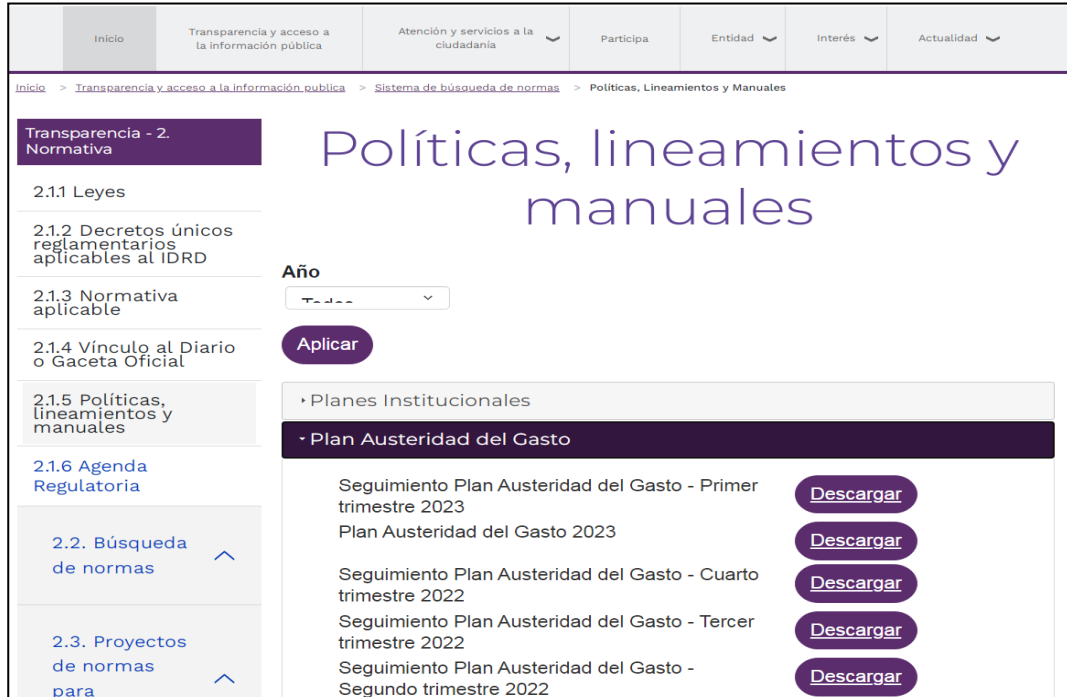
Figura 1. Publicación plan de austeridad y seguimientos