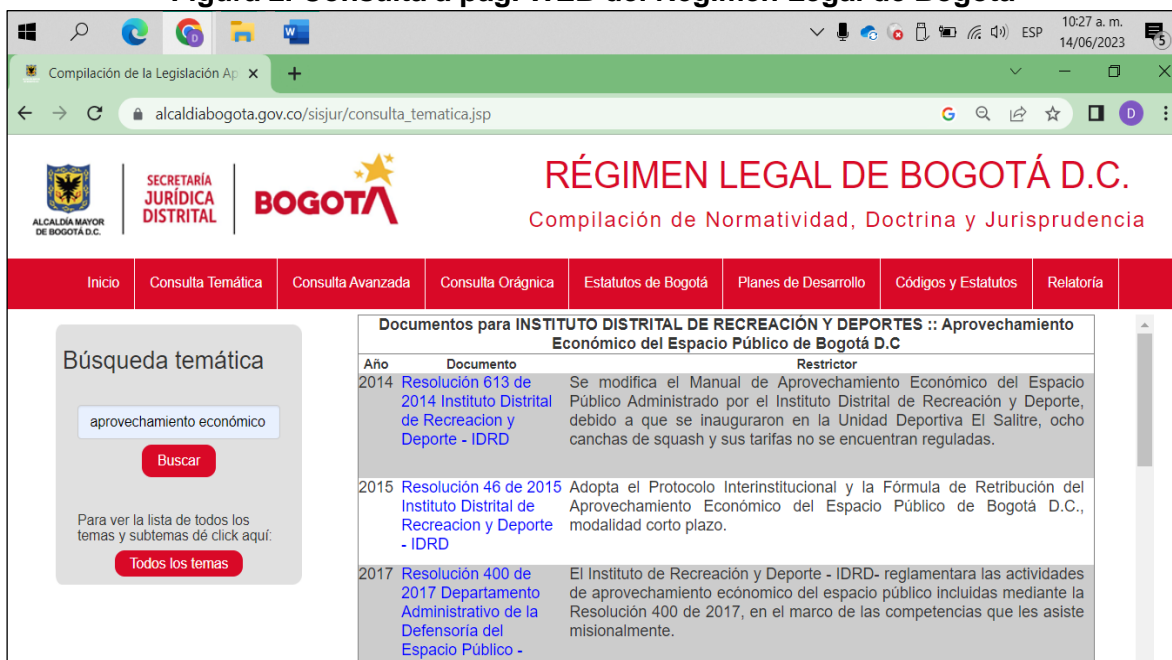
Figura 2. Consulta a pág. WEB del Régimen Legal de Bogotá