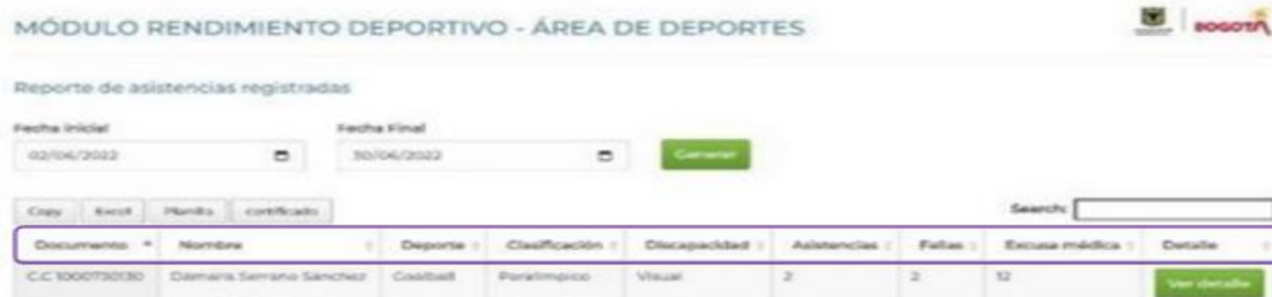
Imagen No. 1 Reporte asistencias entrenamientos deportistas 2021