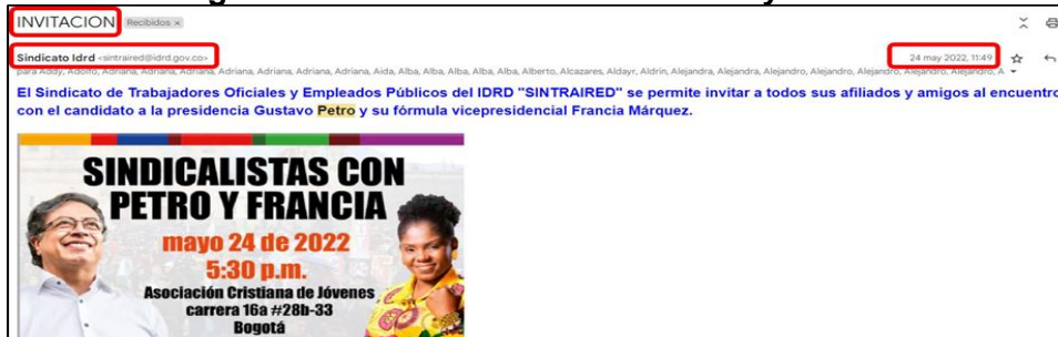
Imagen 1 - Correo Electrónico 24 de mayo de 2022