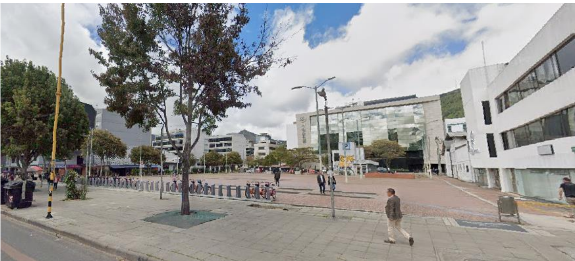
Imagen No. 1. Instituto Distrital de Recreación y Deporte.