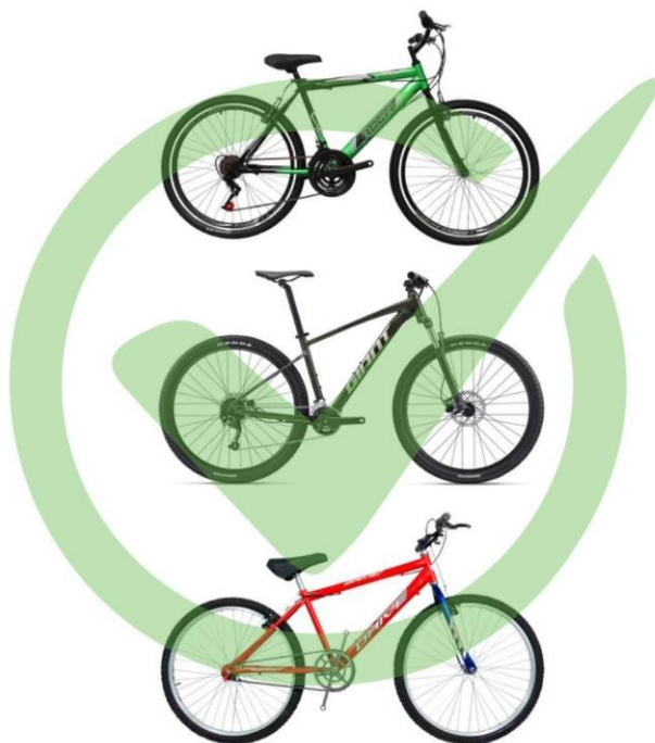
Imagen 3. Tipos de bicicletas admitidas