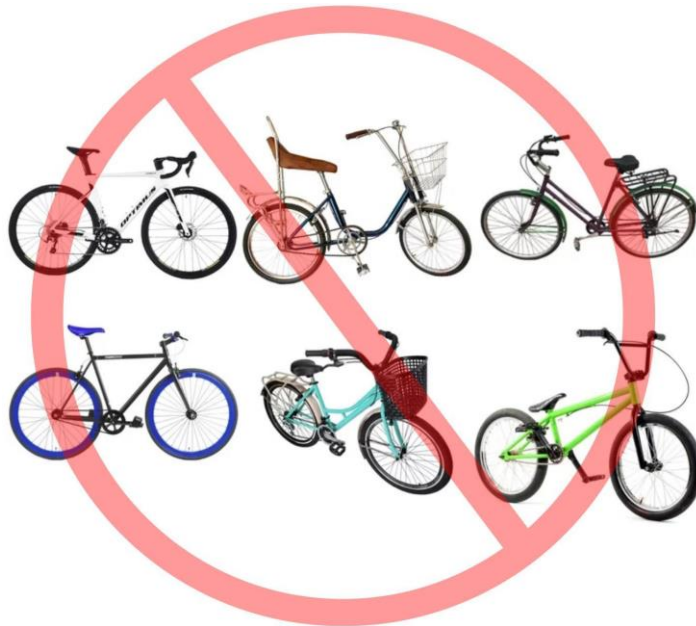
Imagen 2. Tipos de bicicletas NO admitidas