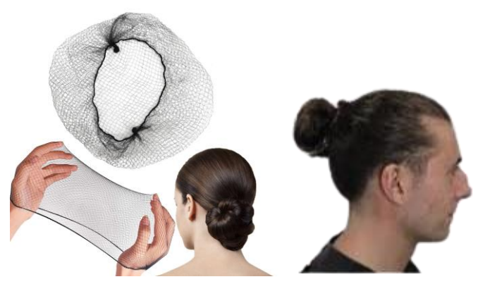
Imagen 5. Adecuado manejo del cabello