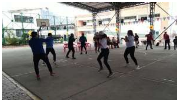
28 de abril 2022: Celebración día de la niñez en apoyo al colegio Juan de la Cruz Varela – La unión / Sumapaz Con el apoyo a los docentes de la escuela de formación deportiva y los consejeros del DRAFE